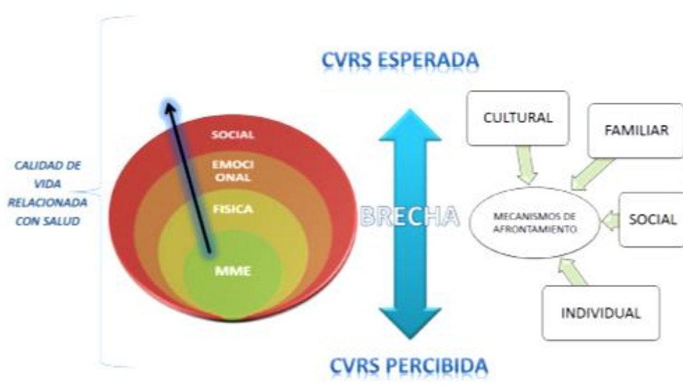
Fig. 1. Modelo de Calidad de Vida Relacionada con salud en Morbilidad Materna Extrema.

Con este modelo en esta investigación se propone hacer un análisis desde la subjetividad de la mujer que sobrevive a este evento desde el concepto de calidad de vida, incorporando los mecanismos de afrontamiento / adaptación de los cuales dispone y que influyen en el estado de salud percibido, frente al idealizado.